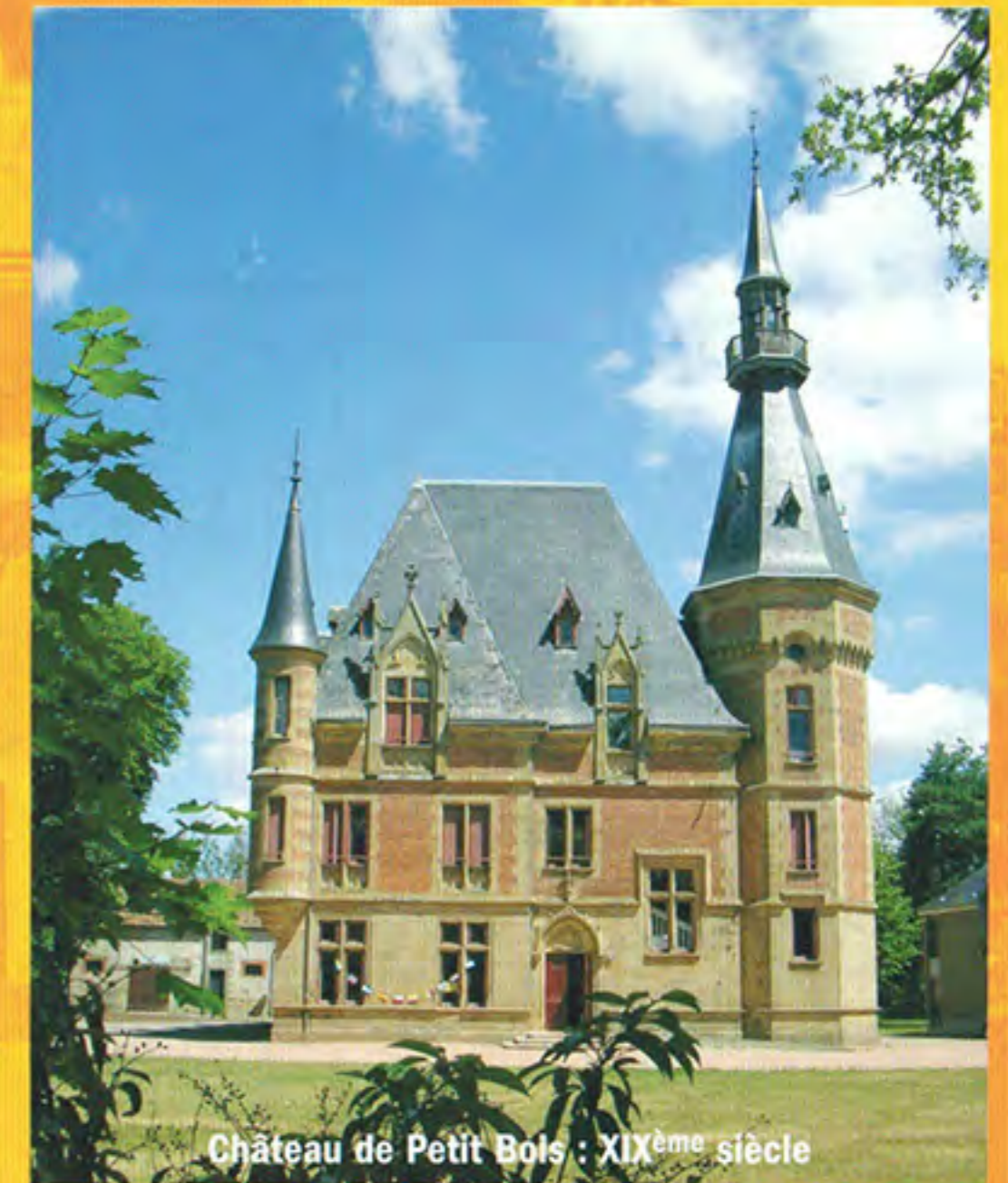
Château de Petit Bois : XIX ème siècle

Cosne d'Allier, petite ville de 2 500 habitants, située au centre de l'ancienne province du Bourbonnais et dont le nom signifie "confluent", s'est construite au creux d'une cuvette (alt. 230 mètres), où se réunissent trois rivières: l'Oeil, le Bandais et l'Aumance, affluents du Cher. Deux voies romaines s'y croisaient ; la plus importante reliant Bourges à Lyon. Cette situation privilégiée explique le renom des foires de Cosne, demeurées longtemps parmi les plus importantes de la région. La ville était autrefois le siège d'une commanderie des Hospitaliers de Saint-Jean de Jérusalem sur le chemin des pèlerinages de Saint-Jacques-de-Compostelle.